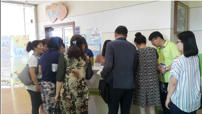
교육 전 접수