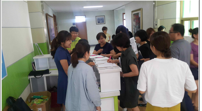
교육 전 접수