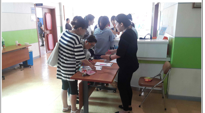
8월 기획사업 자조모임 참가자 접수