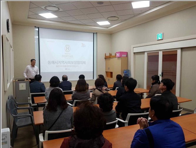
( 교류협력 및 선진지 견학 )