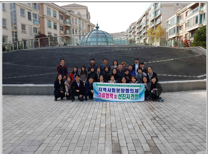
( 교류협력 및 선진지 견학 )