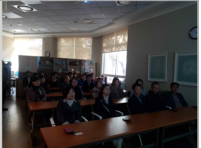
( 교류협력 및 선진지 견학 )