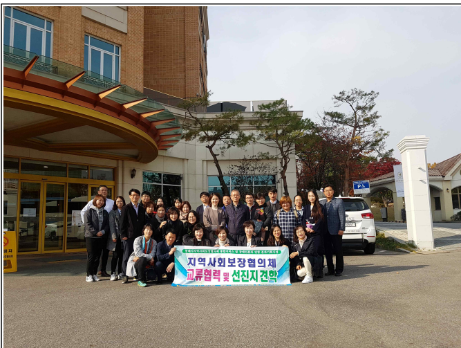
( 교류협력 및 선진지 견학 )