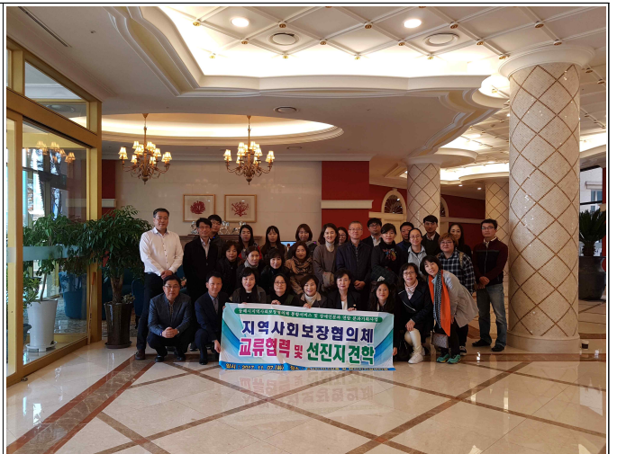
( 교류협력 및 선진지 견학 )