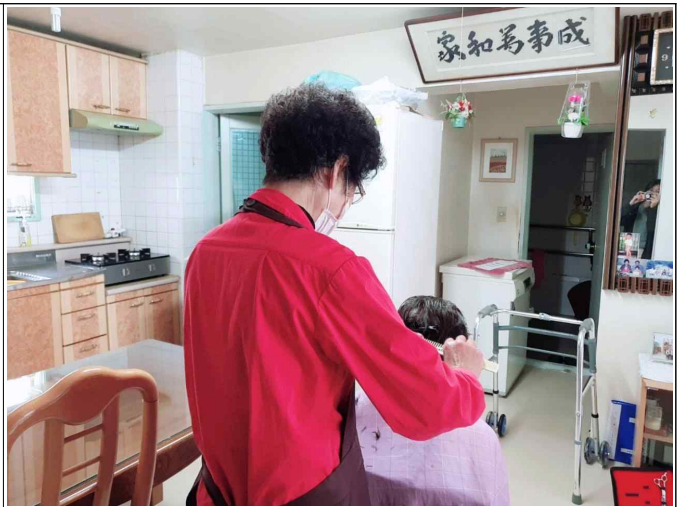
( 10. 14 이○매 )