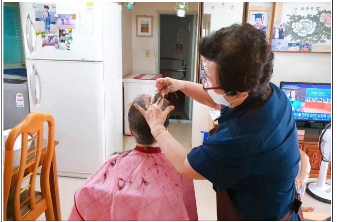
( 8. 13 이이매 )