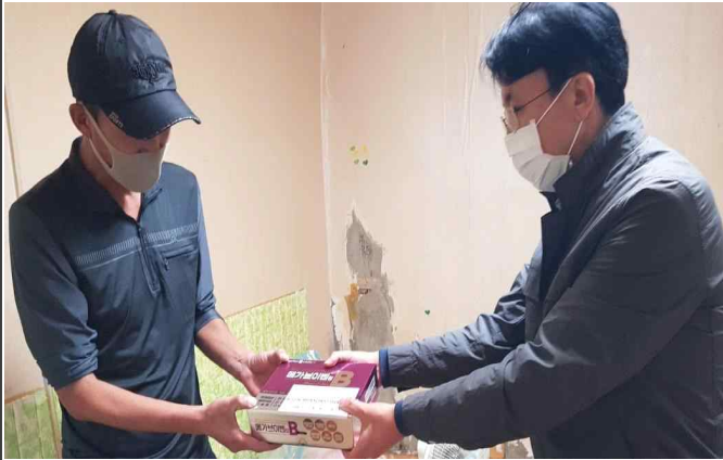
( 대상자 영양제 전달 사진 )