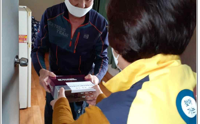
( 대상자 영양제 전달 사진 )