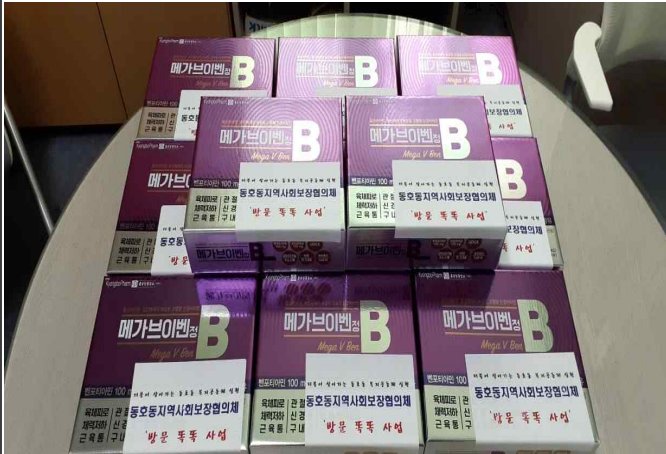
( 방문물품 영양제 사진 )