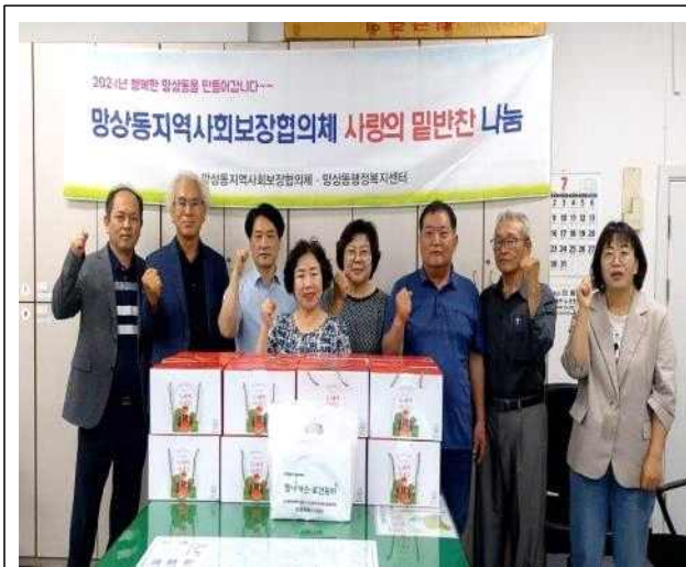
2023년 7월 과일꾸러미(사과즙) 사진