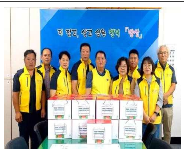
2023년 8월 과일꾸러미(사과즙) 사진