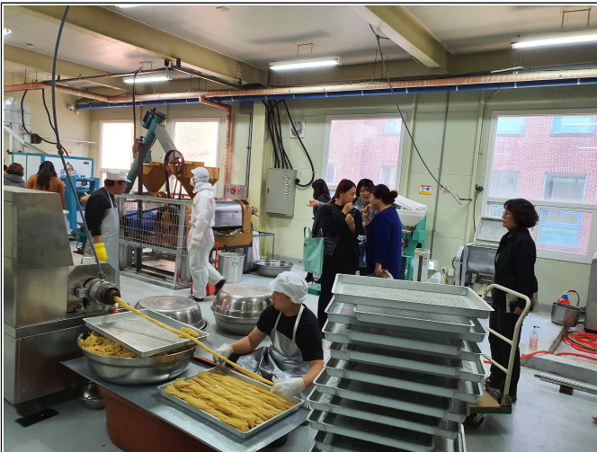
( 공장견학 )