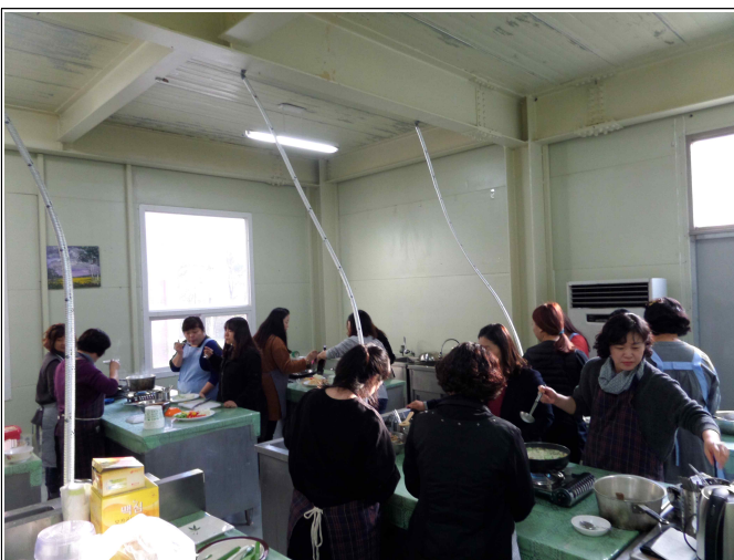
( 음식만들기체험 )