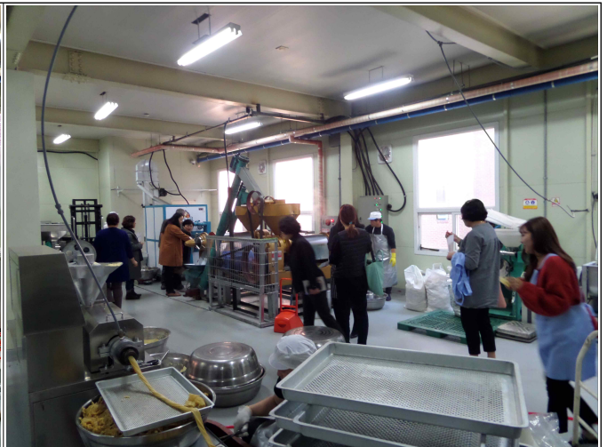
( 공장견학 )