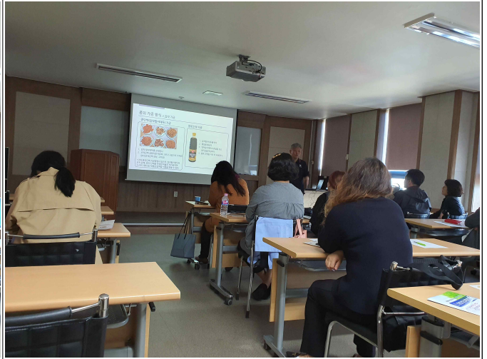
( GMO이론교육 )