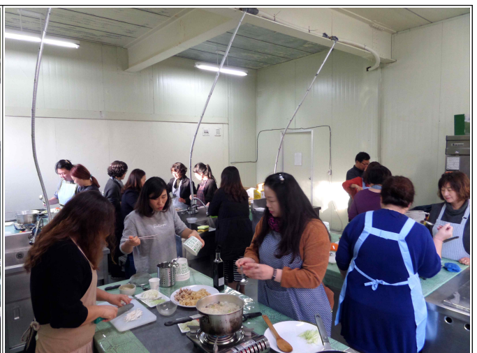
( 음식만들기체험 )