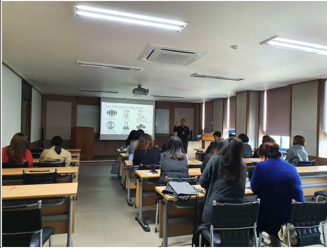
( GMO이론교육 )