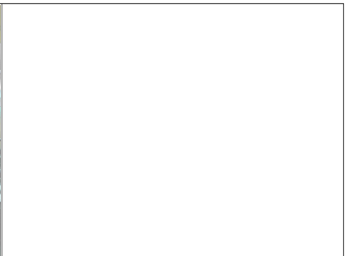
(복지음악회 및 복지사각지대 발굴 기초 현황 조사)