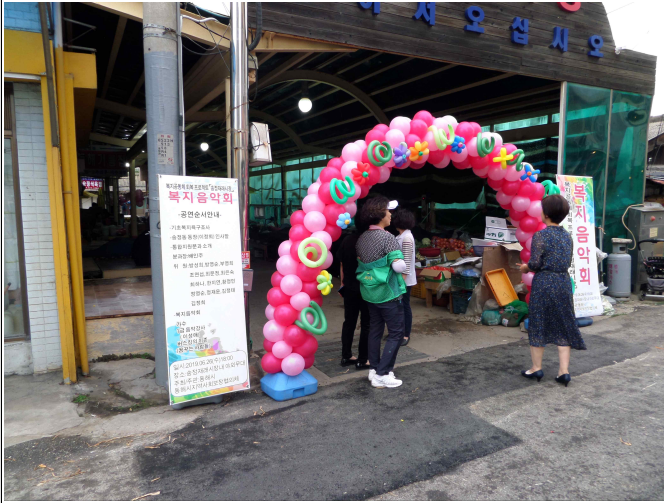
(복지음악회 및 복지사각지대 발굴 기초 현황 조사)