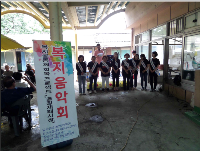
(복지음악회 및 복지사각지대 발굴 기초 현황 조사)