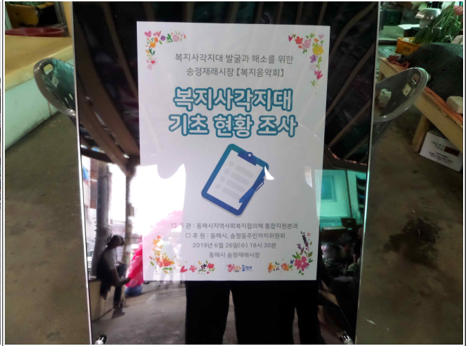
(복지음악회 및 복지사각지대 발굴 기초 현황 조사)