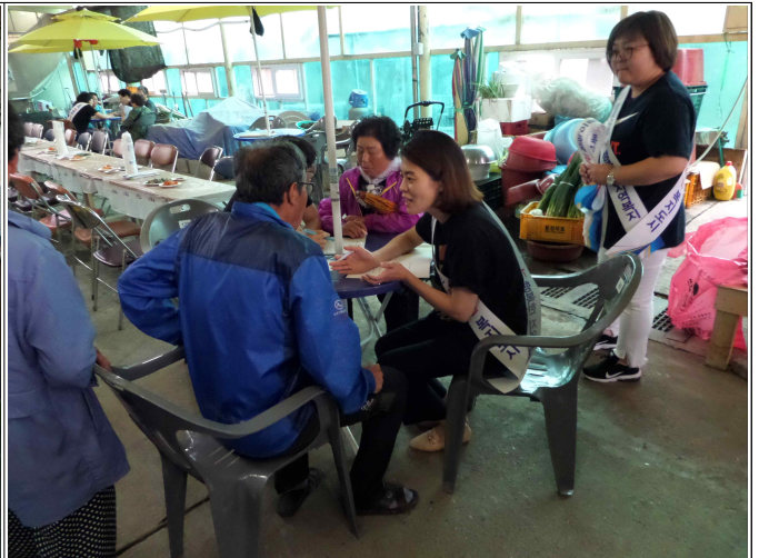
(복지음악회 및 복지사각지대 발굴 기초 현황 조사)