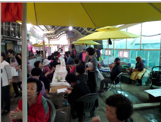
(복지음악회 및 복지사각지대 발굴 기초 현황 조사)