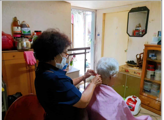
( 9. 10 도순여 )