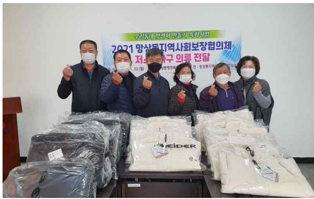
(멋쟁이만들기 전달 행사1)