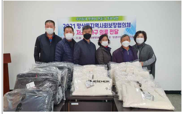
(멋쟁이만들기 전달 행사2)