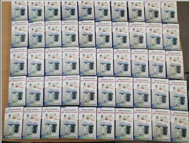
( 포충기 )