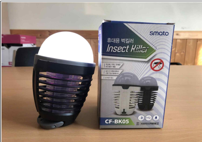
( 포충기 세부사진 - 1 )