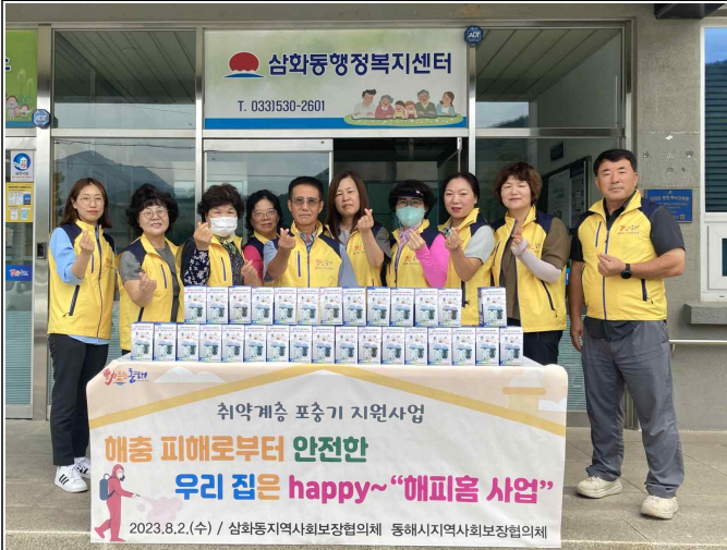
( 단체사진 )