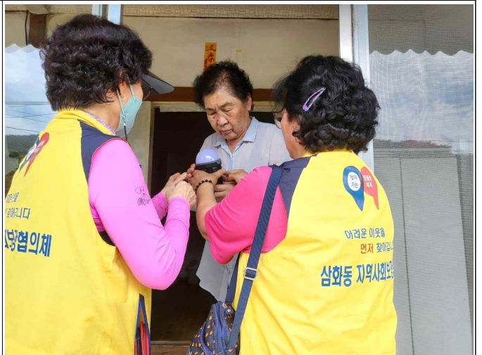
( 대상가구 전달 및 안부확인 )