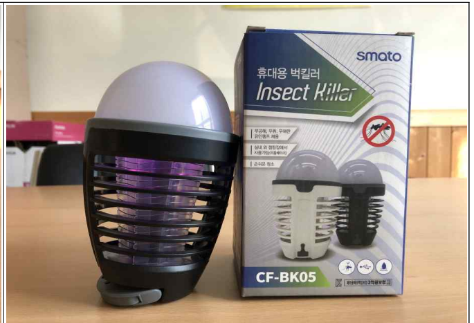
( 포충기 세부사진 - 2 )