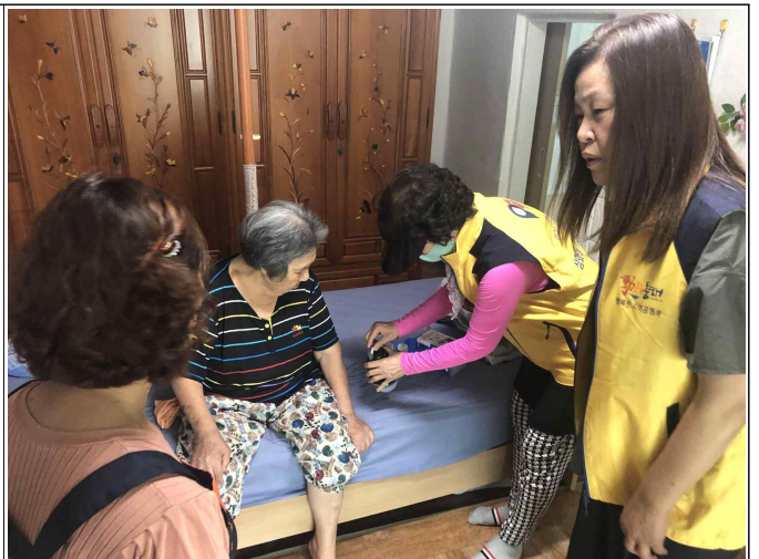
( 대상가구 전달 및 안부확인 )