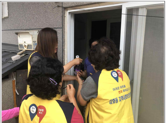
( 대상가구 전달 및 안부확인 )